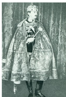
IV. Károly osztrák császár és magyar király