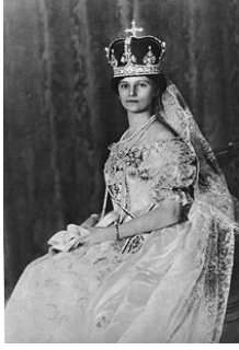
(Bourbon-Pármai) Zita királyné (IV. Károly felesége)