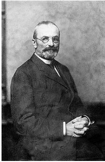
Gróf Tisza István magyar miniszterelnök